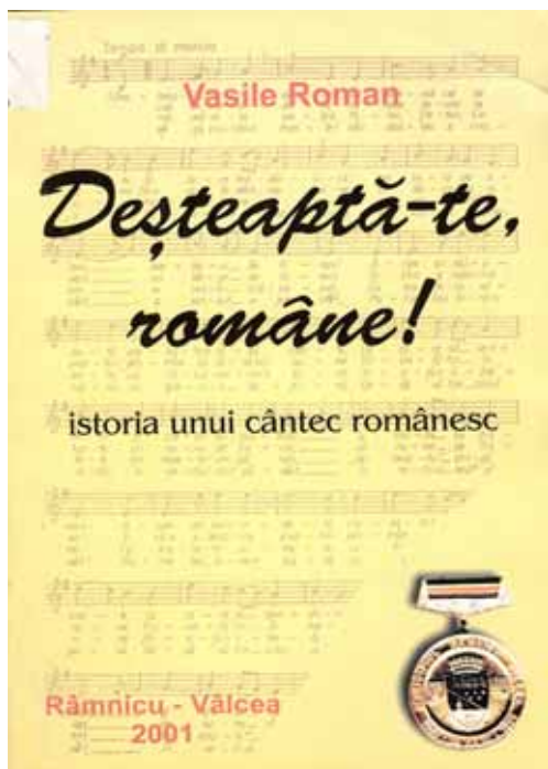
Coperta cărții lui Vasile Roman