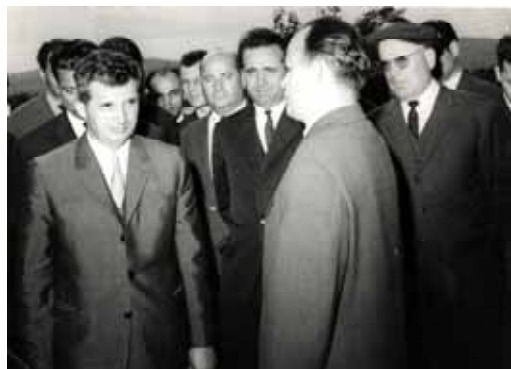
1966, Râureni. Petre Purcărescu îi dă raportul secretarului general al PCR, Nicolae Ceaușescu