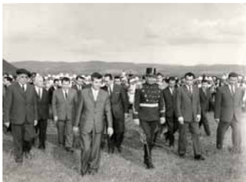
1966, Nicolae Ceaușescu în tabara de la Râureni. Aici s-a reactivat melodia Imnului actual, după instaurarea comunismului în România