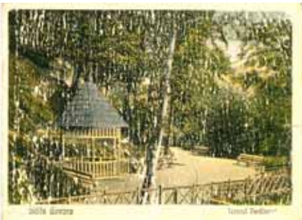
Izvorul Ferdinand Prima amenajare-1906