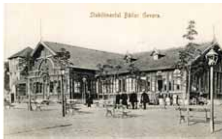
Vechiul Stabiliment de Băi-1907