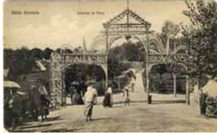
Intrarea în parc-1911