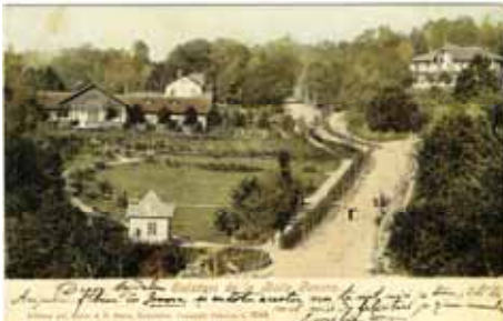
Hotelul Statului nr. 2 – 1905 dreapta