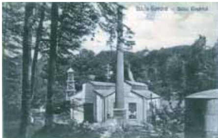
Uzina Electrică - 1924