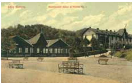
Hotelul Statului nr. 1– 1909 dreapta