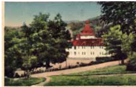
Pavilionul Băi - 1912