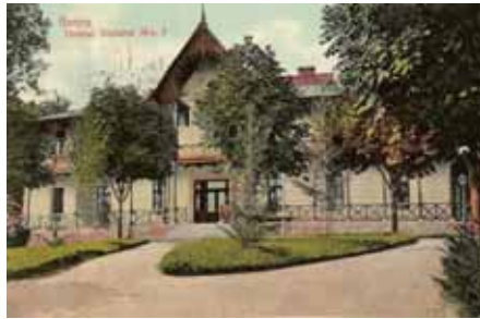
Hotelul Statului nr. 3 - 1912