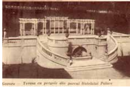
Terasa cu pergole-1931