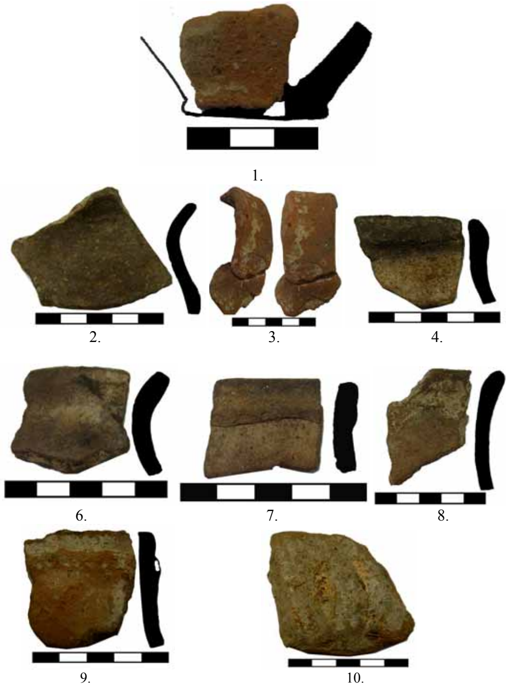
Fig. 9. Cultura Coțofeni. Ocnița-Aval Baraj