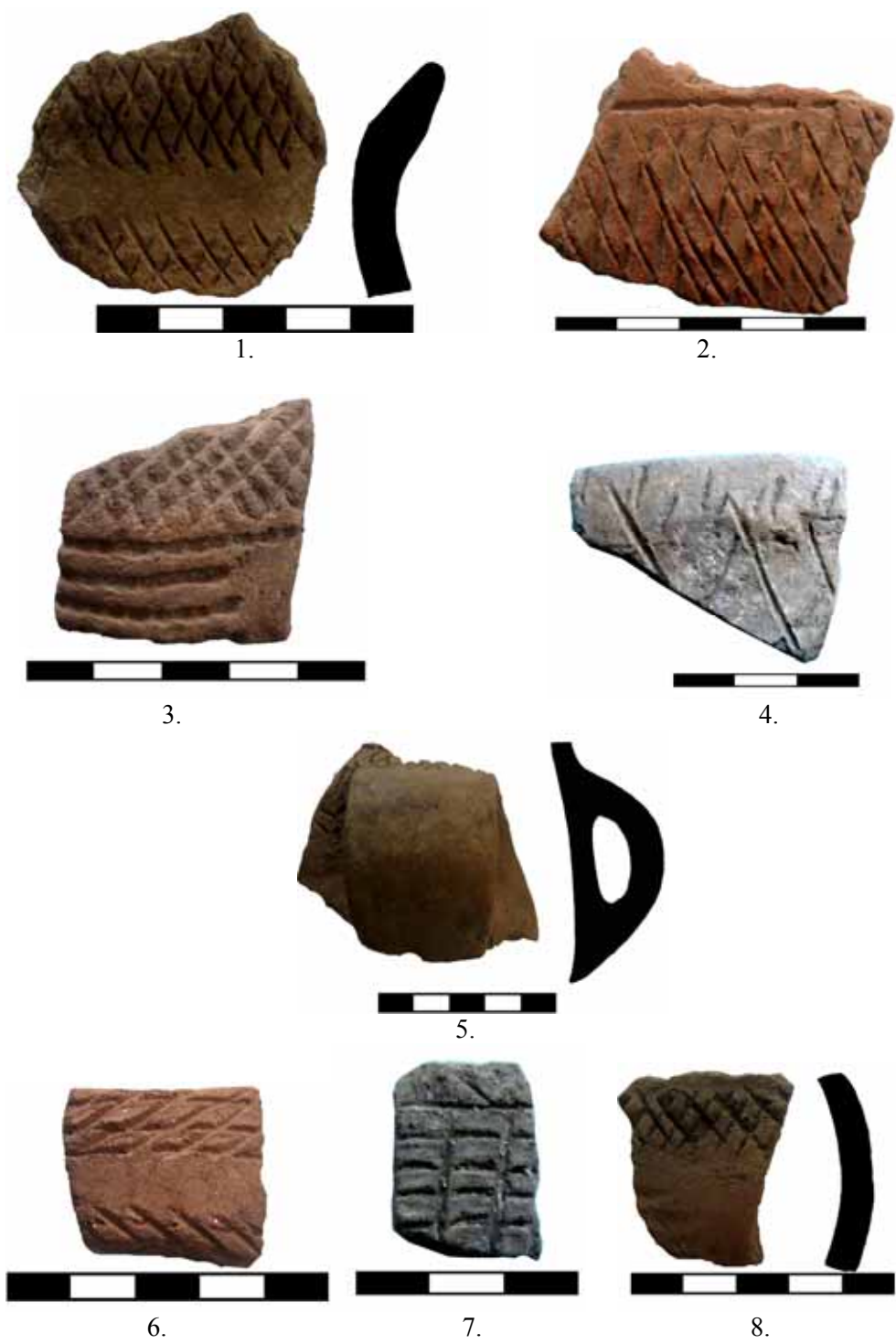
Fig. 4. Cultura Coțofeni. Ocnele Mari-Zdup