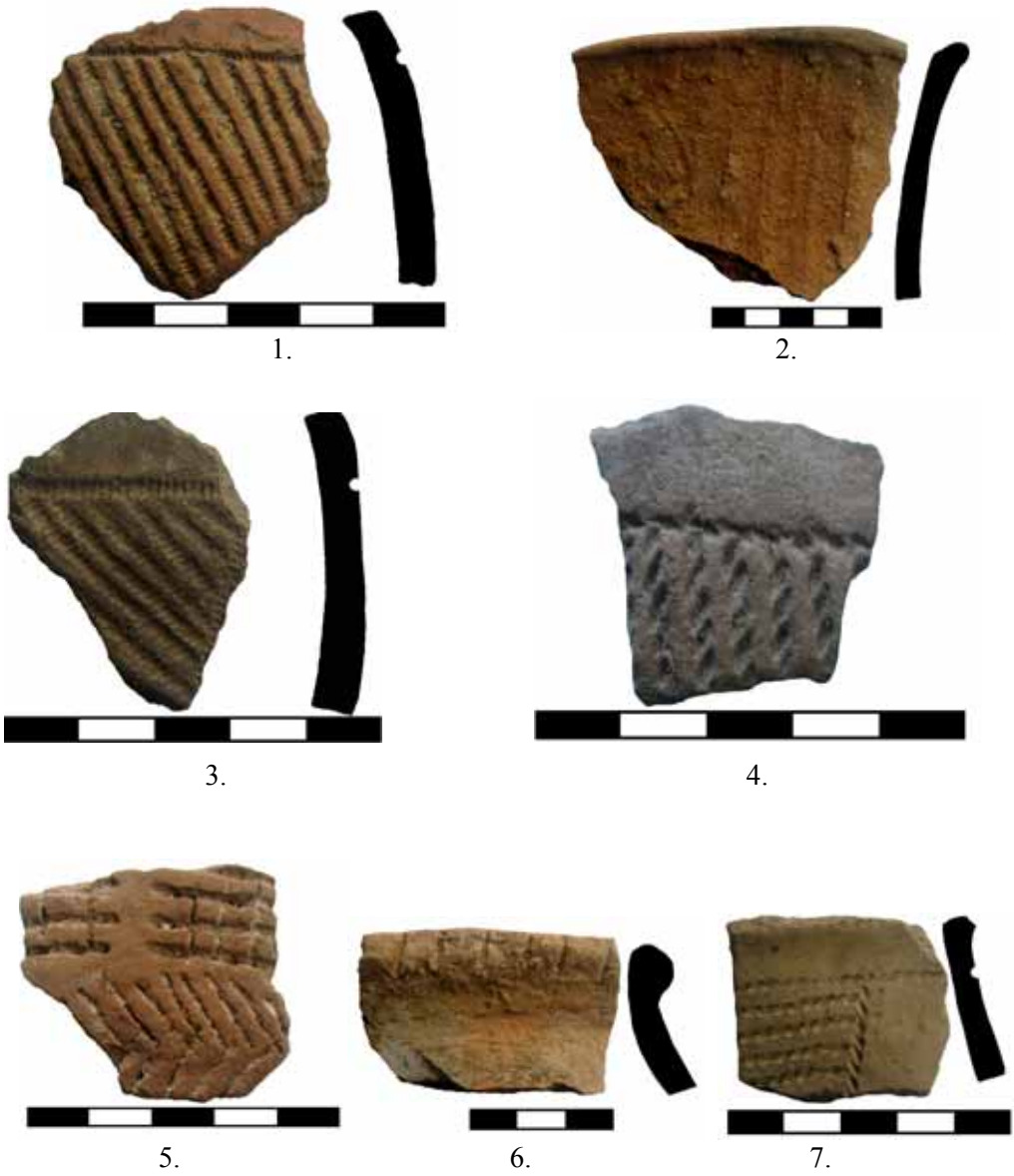
Fig. 5. Cultura Coțofeni. Ocnele Mari-Zdup