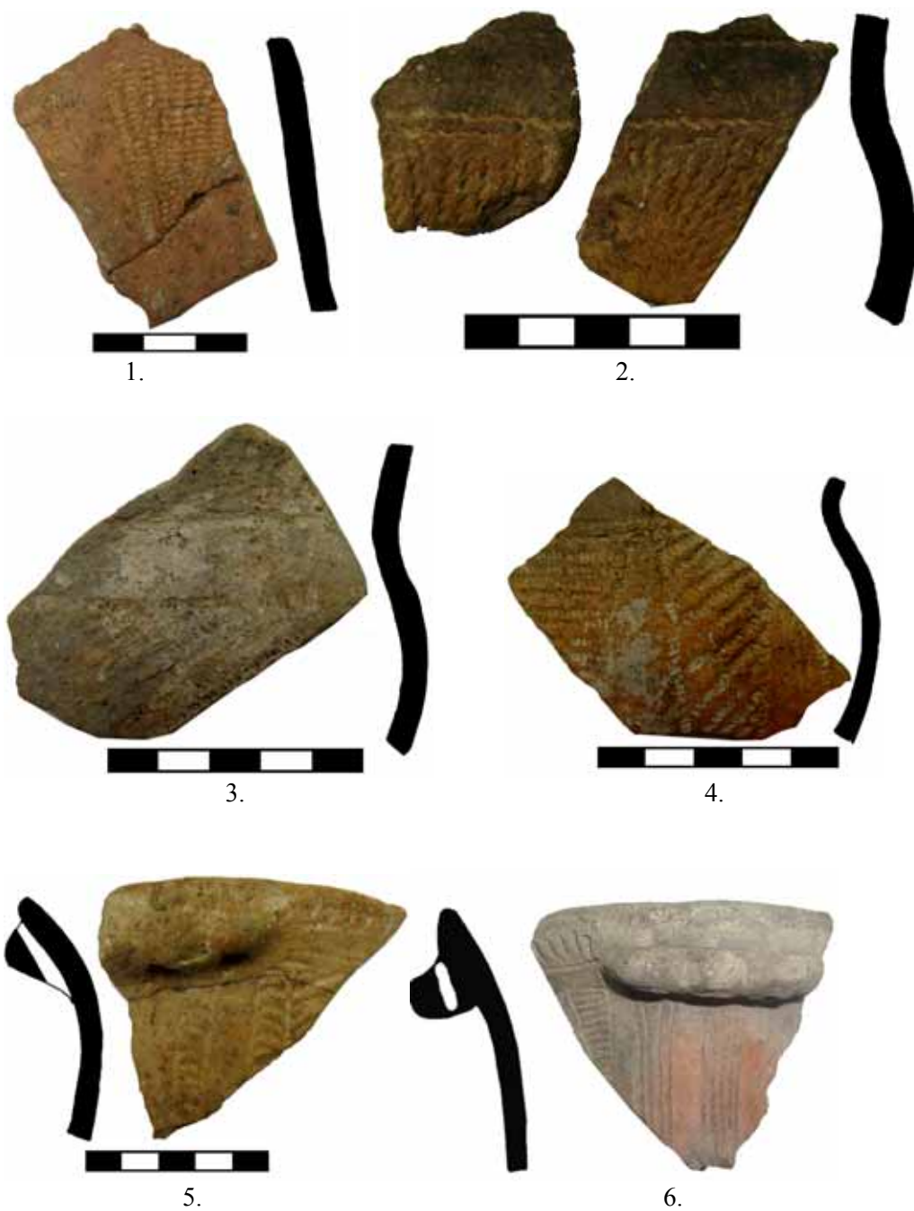
Fig. 7. Cultura Coțofeni. 1-5, Očnița-Aval Baraj; 6 -Očnița-Cosota