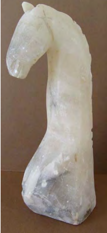
Cap de cal