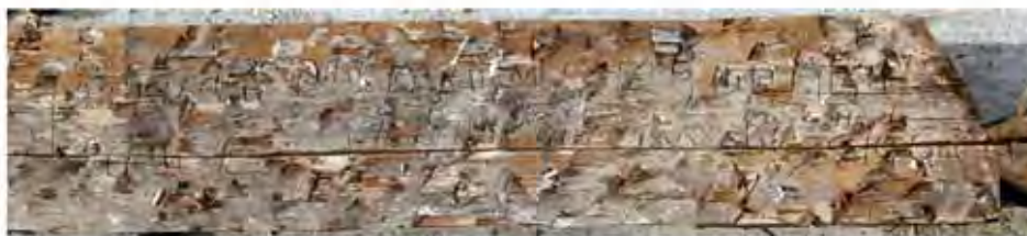
Pisania mai veche de pe aceeași grindă înainte de restaurare.