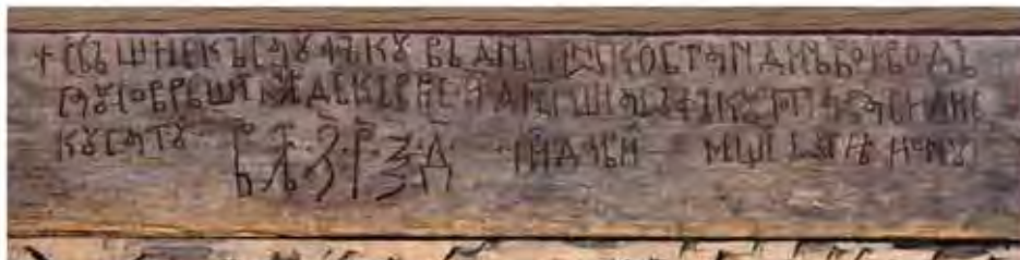
Pisania de la 8 decembrie 1655 (după restaurare) descoperită pe o grindă aflată sub tencuială.