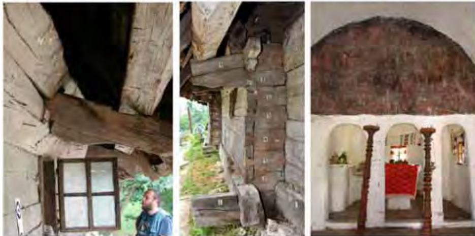
Biserica de lemn Sf. Nicolae din Pietrari-Anghelești: vederi in situ din anul 2009.