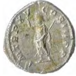
10. CARACALLA Număr de inventar: 14029.