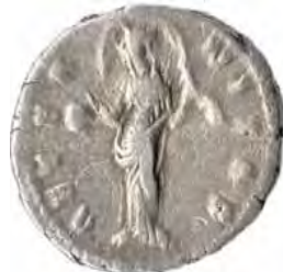
2. ANTONINVS PIVS: FAVSTINA I Număr de inventar: 14030.