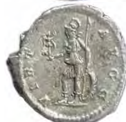
4. SEPTIMIVS SEVERVS Număr de inventar: 14024.