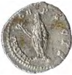
5. SEPTIMIVS SEVERVS Număr de inventar: 14026.