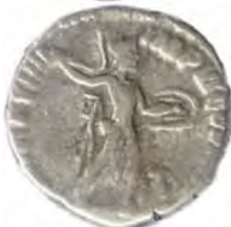
3. COMMODVS Număr de inventar: 14028.