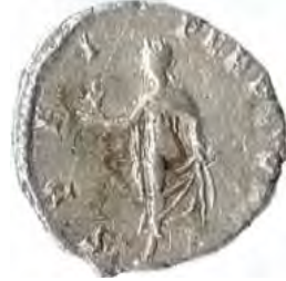
8. SEPTIMIVS SEVERVS: CARACALLA Număr de inventar: 14032.