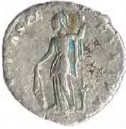
7. SEPTIMIVS SEVERVS: CARACALLA Număr de inventar: 14033.