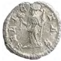
6. SEPTIMIVS SEVERVS: IVLIA DOMNA Număr de inventar: 14025.