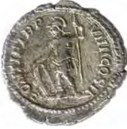
9. SEPTIMIVS SEVERVS: CARACALLA Număr de inventar: 14031.