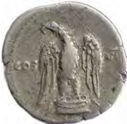
1. VESPASIANVS Număr de inventar: 14027.