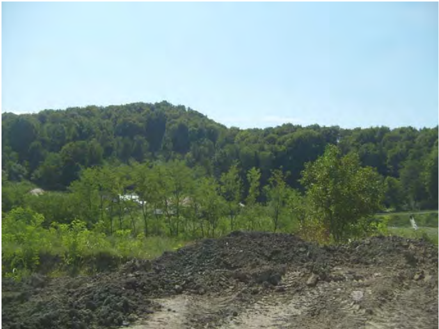
Foto. 2. Vedere spre așezarea de la Ocnîța