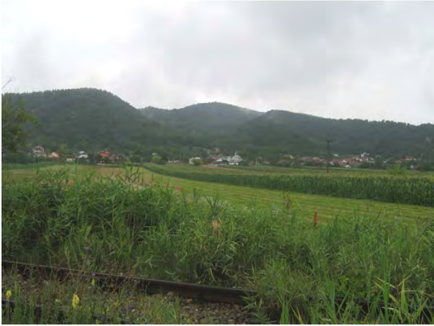
Foto. 1. Așezarea de la Copăcelu