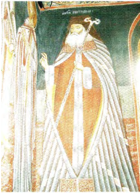
Mănăstirea Govora – Mihăești. Antim Ivireanul, mitropolitul Ungrovlahiei.