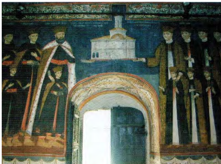
Mănăstirea Surpatele – Frânțești. Tabloul votiv al Brâncovenilor.