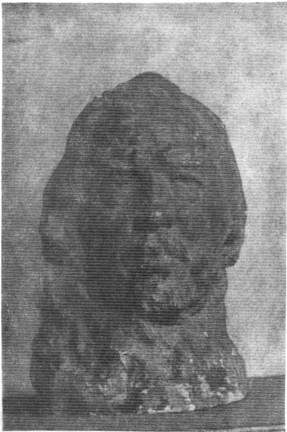
Portretul pictorului Eugen Voinescu (Ceau)