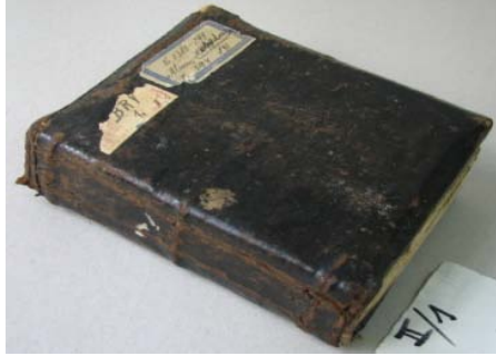
Volum înainte de restaurare