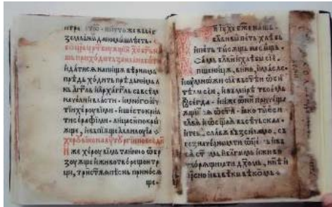
Volum în interior