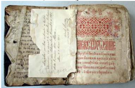
Forzaț anterior (partea fixă), foaie de titlu