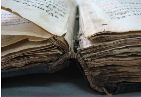
Bloc deschis (vedere tranșa și capitalband)