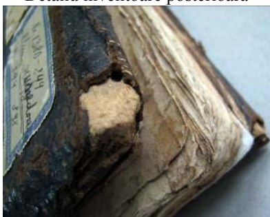
Detaliu colț dreapta sus