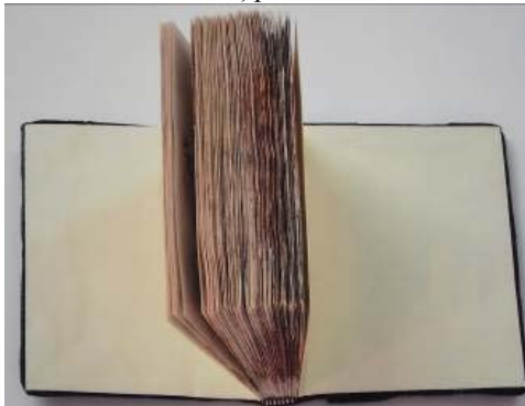
Forzațuri dupa restaurare