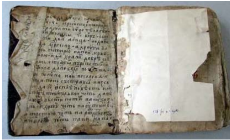
Forzaț anterior (partea fixă)